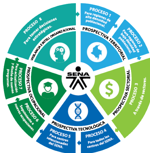
Figura 1. Procesos de prospectiva del Sistema PREVIOS